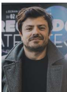
EXPERT Pablo Carrizosa Totem Films FRANCIA